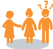
Gesprächen nicht mehr folgen können