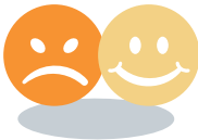
Veränderungen der Stimmung oder/und des Verhaltens