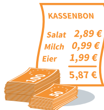
Schwierigkeiten mit alltäglichen Aufgaben