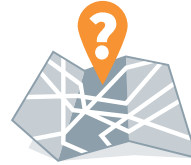
Fehlende Orientierung zur Zeit und an fremden Orten