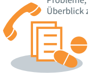
Probleme, den Überblick zu behalten