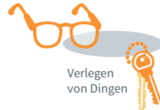
Verlegen von Dingen